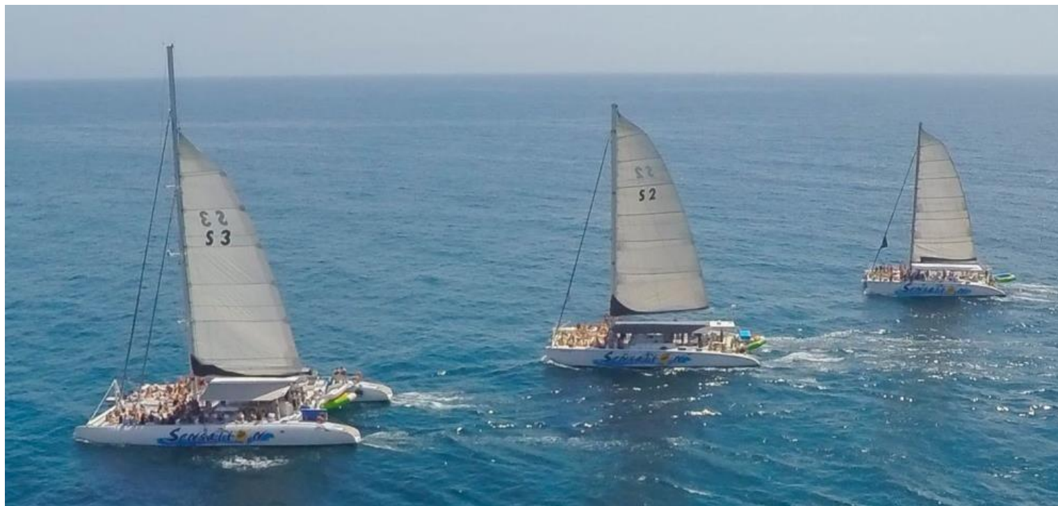
S1 79 places